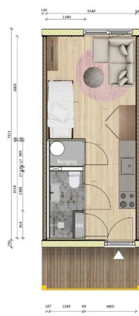
PMC 11_22 m 2

Het idee is dat er op twee kavels aan de Willem van Gispensstraat in totaal zes woonblokken komen. Het gaat in totaal om 140 flexwoningen. Het ontwerp en alle informatie over de woningen is te vinden op www.woonstadrotterdam.nl/flex-nesselande .